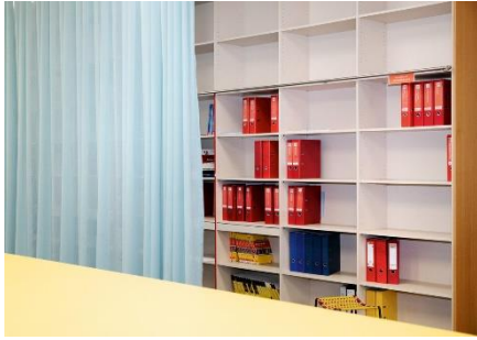
Impressionen aus dem Weißen Haus